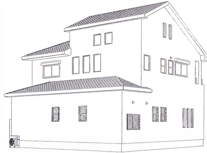
パース方向7外觀透視図