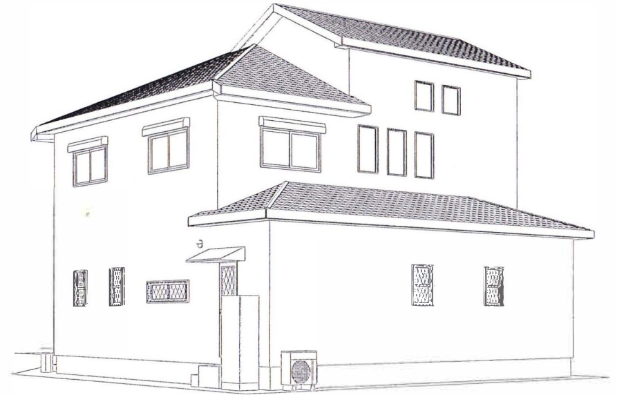
パース方向5外觀透視図