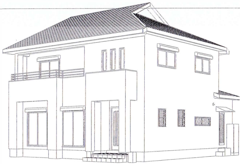
パース方向3外觀透視図